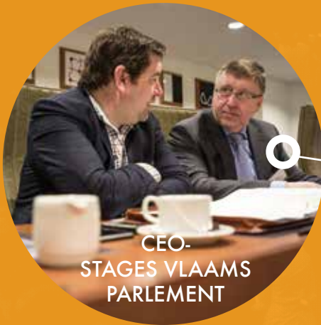
CEO- STAGES VLAAMS PARLEMENT