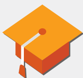
Opleidingen bij de tijd krijgen

De Vlaamse regering maakt werk van twee Voka-prioriteiten: extra middelen voor mobiliteit en voor innovatie. Ze zal in de volgende jaren 195 miljoen extra voorzien voor investeringen in onderzoek en ontwikkeling. Het gaat hier om een eerste schijf uit een ruimere enveloppe die nodig is om Vlaanderen als kennisregio te bevestigen. Voor mobiliteit komt er, alweer in een eerste schijf, 100 miljoen extra voor infrastructuurinvesteringen die nodig zijn om de fileproblemen te verminderen.