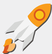
Investeren in innovatie en mobiliteit