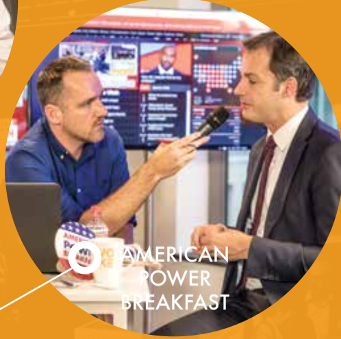
AMERICAN POWER BREAKFAST