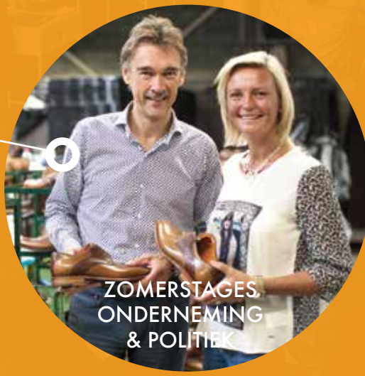
ZOMERSTAGES ONDERNEMING & POLITIEK