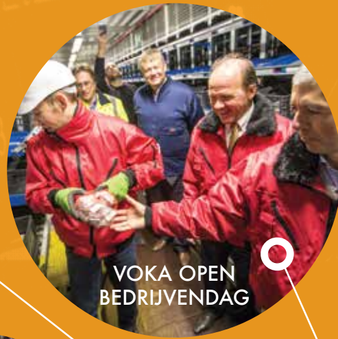
VOKA OPEN BEDRIJVENDAG